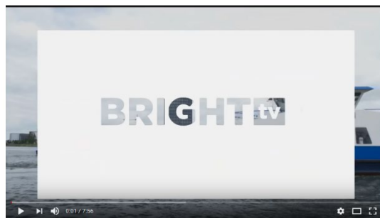
Wees Wijs met Wifi: de risico's van publieke wifi-hotspots

Kijk op YouTube naar https://youtu.be/nxJG4J36Hpw of zoek op YouTube naar 'Wees Wijs met wifi: de risico's van publieke wifi-hotspots'