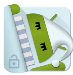
Sleep as Android Android