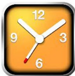
Sleeptime iOS en Android